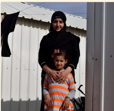
CARE analyse rapide de genre [Région] - [Couverture géographique]

La boîte à outils d'Analyse rapide de genre de CARE est disponible en ligne avec un accès ouvert aux ressources qu'elle contient. Elle comprend des conseils sur la façon de compléter toutes les étapes d'une analyse rapide du genre. Les outils peuvent être adaptés en fonction de la situation unique de chaque pays. En plus des notes d'orientation, la boîte à outils de ARG comprend des outils pour la collecte de données primaires, l'examen des données secondaires, l'analyse des données recueillies, et la formulation des recommandations. Il y a aussi un format de rapport qui doit être utilisé lors de la rédaction des rapports d'ARG.